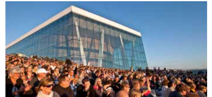
Sommer på Operaen