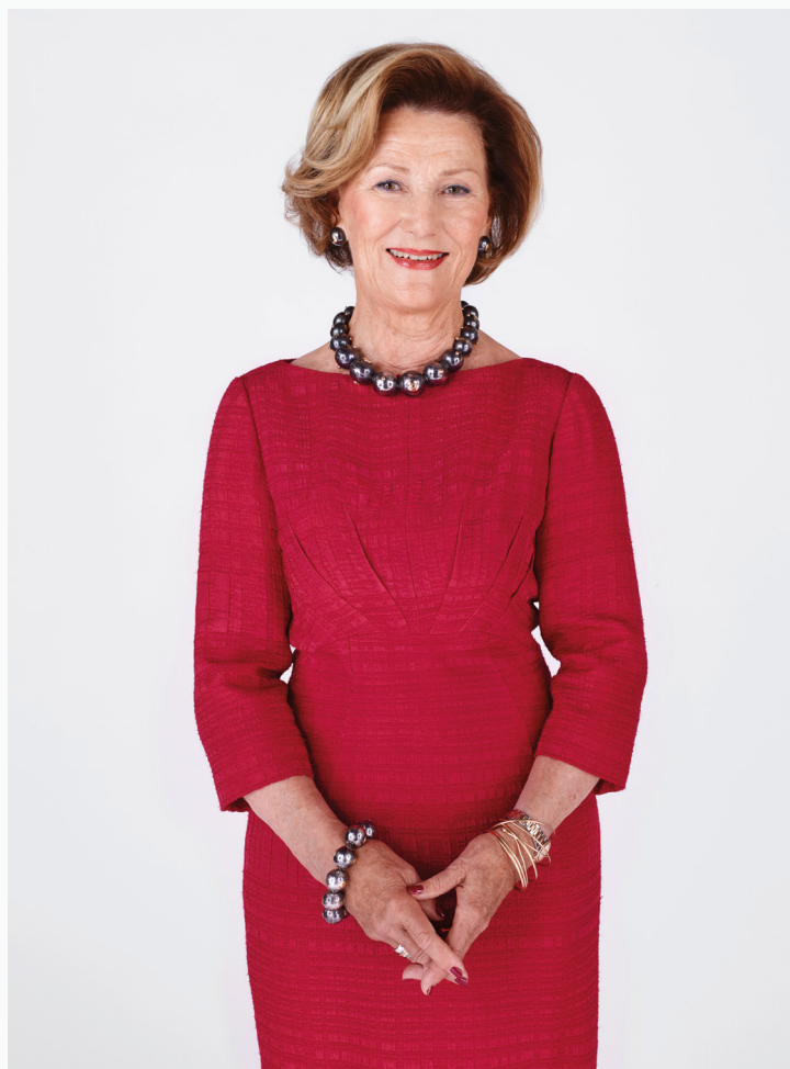
H. M. Dronning Sonja

Den Norske Opera & Balletts høye beskytter